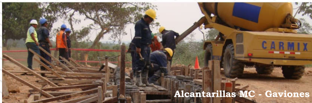
Alcantarillas MC - Gaviones