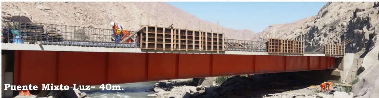
Puente Mixto Luz= 40m.