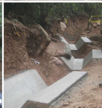
Zanja de Coronación Revestimiento : Geomembrana y concreto