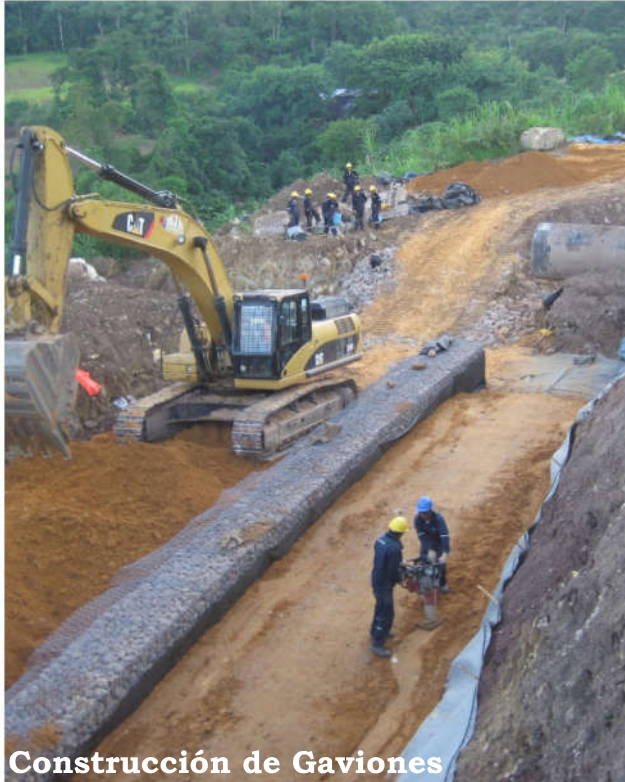
Construcción de Gaviones