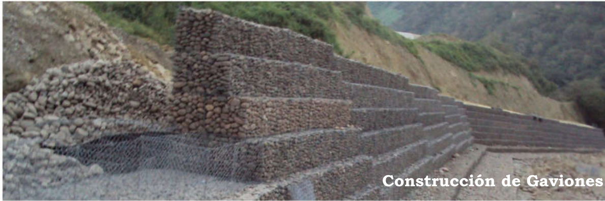
Construcción de Gaviones