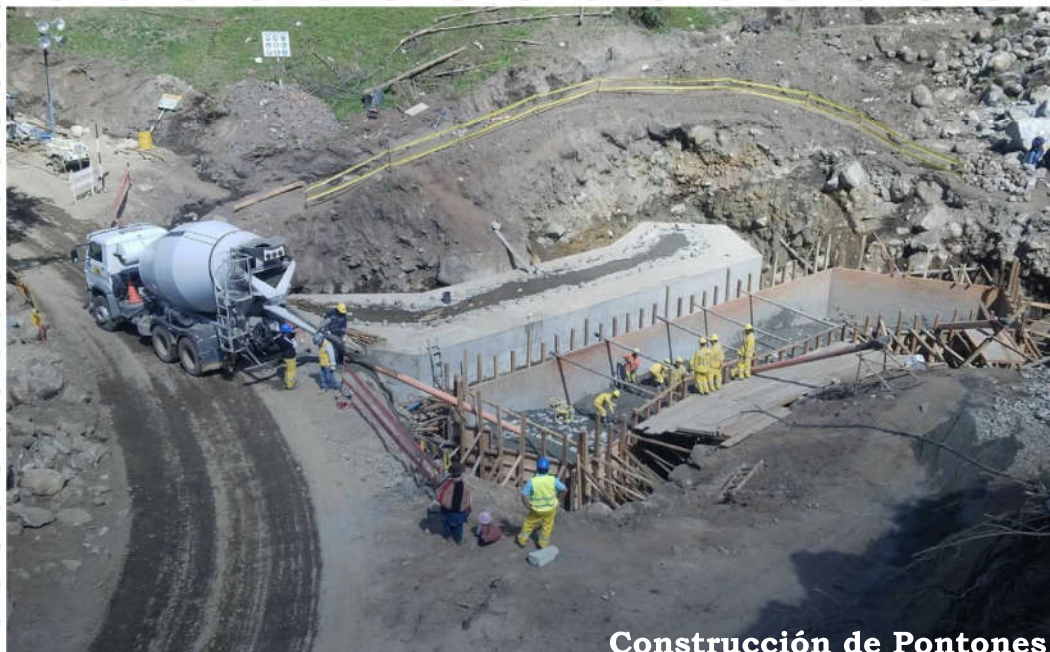
Construcción de Pontones