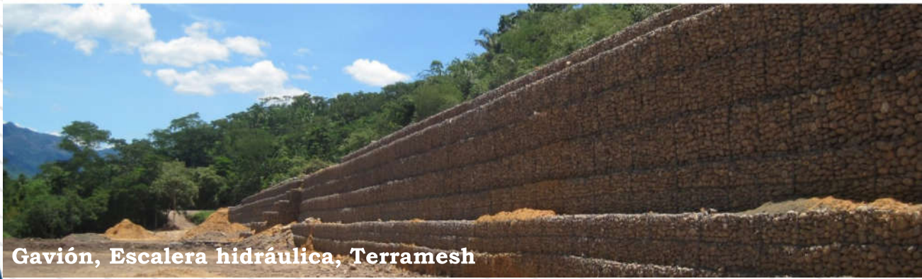
Gavión, Escalera hidráulica, Terramesh