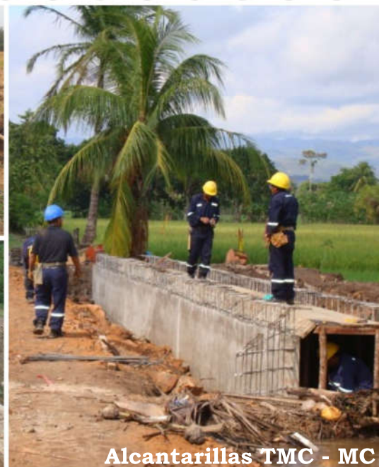
Alcantarillas TMC - MC